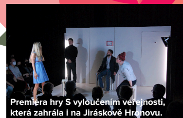
Premiéra hry S vyloučením veřejnosti, která zahrála i na Jiráskově Hrnovu.