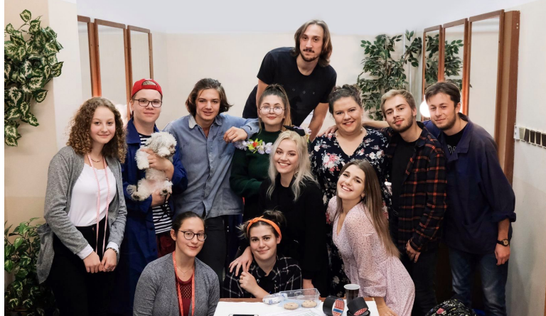
Divadelní klub mladých po premiéře inscenace Čapkoviny...

Zakončení 45. ročníku s divácky nejoblíbenější neprofesionální hrou poslední dekády II Congelatore – Zmrazovač od Kočovného divadla Ad Hoc. Jen v České Lípě byli již třikrát a vždy měli plno. Mafiánská operní parodie s geniálním českým libretem k áriím. 23. 10., 19:00, KD Crystal