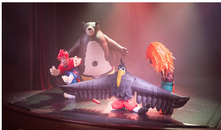
Obří nafukovací kostýmy v závěru představení Mimjové.

„Vtáhlo mě to do děje. Bylo to osvěžující. Ani mi nevadilo, že